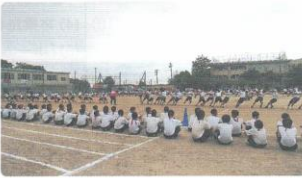
2021年5月開催の体育祭(綱引き)

一人の二中に入らせて良かった」という質問でも95%となっています。このことは、生徒一人一人が、自分のために、友達のた