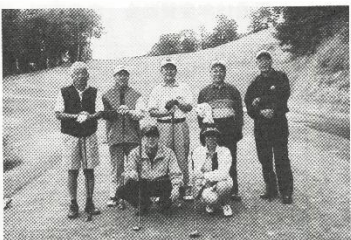
2004.8.23. 水上にて